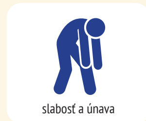
slabosť a únava