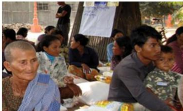
EU Aid Volunteers

Komunitárne programy Európskej únie (3. pilier), slúžia k prehĺbovaniu spolupráce a riešeniu spoločných problémov členských krajín EÚ v oblasti konkrétnych politík EÚ.