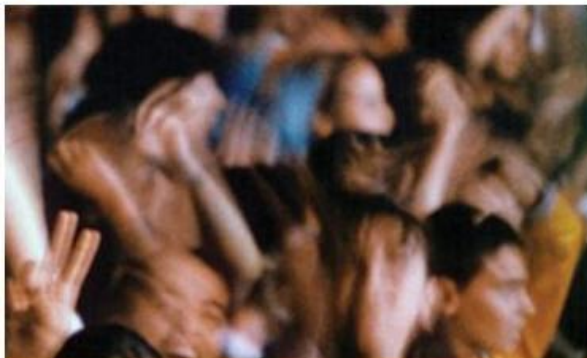
Europe for Citizens