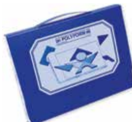
Didaktická pomôcka základy geometrie a rovinné útvary 1 ks