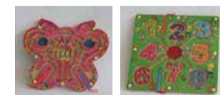
Hracia doska pre najmenších čísla a motýľ 5 + 5 ks