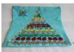
Základy matematiky interaktívna hra 1 ks