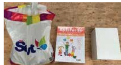
Edukatívny kufrík II 1 sada