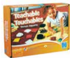
Súprava mäkkých hmatových poduštičiek 1 ks