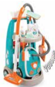
Upratovací vozík 1 ks