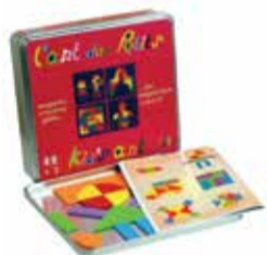
Didaktická pomôcka na rozpoznávanie a kombináciu farieb a tvarov 1 ks