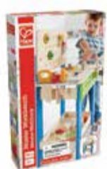
Detský pracovný stôl s príslušenstvom 1 ks