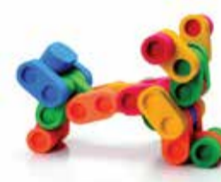
Stavebnica s viacerými modelmi s pevným stĺpikom a dutým kruhom na zlepšenie kreativity 1 ks