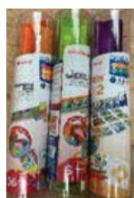
Edukačná sada činnosti základnej hygieny a čistoty 3 ks