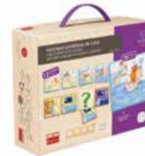
Obrázkové rozprávky s výberom dejovej línie 1 ks