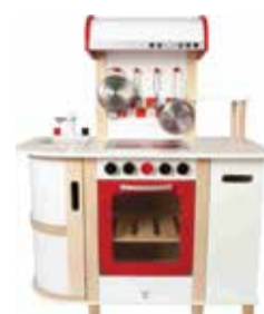
Detská kuchynka s funkčnými prvkami 1 ks