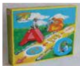
Edukačná hra písmená a slovíčka 1 ks