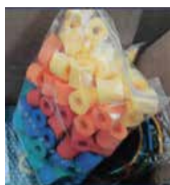
Didaktická hra pre rozvoj sociálnych zručností, kreativity, jemnej motoriky a pamäte 1 ks