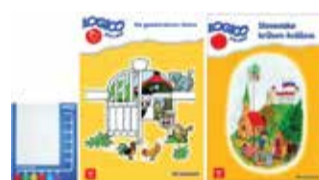
Sada didaktických samo opravných pomôcok 1 sada