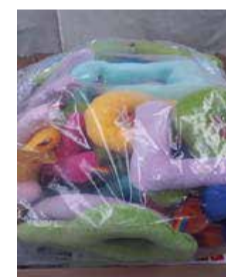
Súprava mäkkých penových čísel so zvieracou textúrou 1 ks