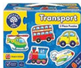
Skladačka - dopravné prostriedky 2 ks