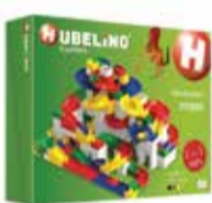
Didaktická stavebnica guľôčková dráha 2 ks