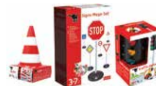
Súprava dopravná výchova 1 sada