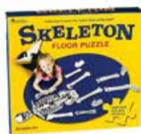
Skladačka ľudská kostra 1 ks