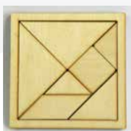
Drevený hlavolam viacdielny pre rozvoj jemnej motoriky a priestorového vnímania 5 ks