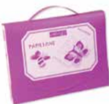
Didaktická pomôcka precvičovanie a rozvoj drobných pohybových prejavov a aktivít 1 ks