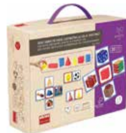
Edukatívny kufrík I 1 ks