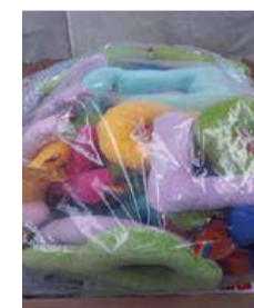
Súprava mäkkých penových písmen s pestrofarebnou textúrou 1 ks