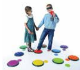
Súprava taktilných diskov na rozvoj hmatových zmyslov 1 ks