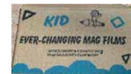
Didaktická magnetická sada 2 ks