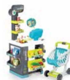
Detský obchod 1 ks